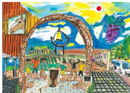
最優秀賞作品「ワイナリー」