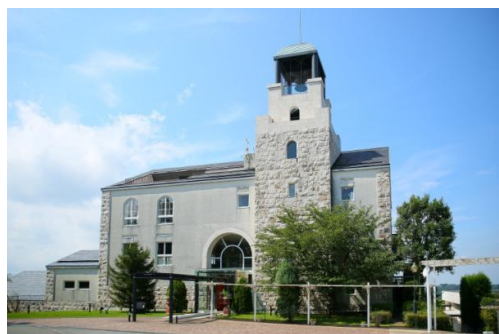
中伊豆ワイナリー シャトーT.S